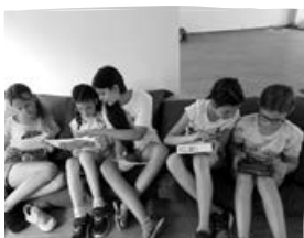
Erzsébet-tábor Zánkán – 3–8. évfolyam .....