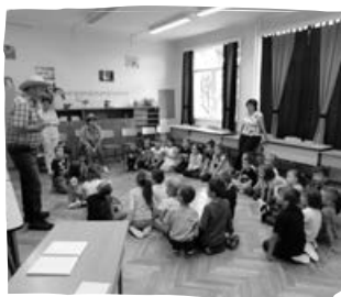
Játékos ismerkedés az iskolával az 1. évfolyam számára .....