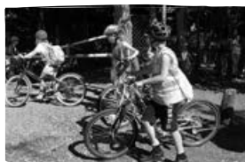
Táborozás Órimagyarósdon – 4. évfolyam .....