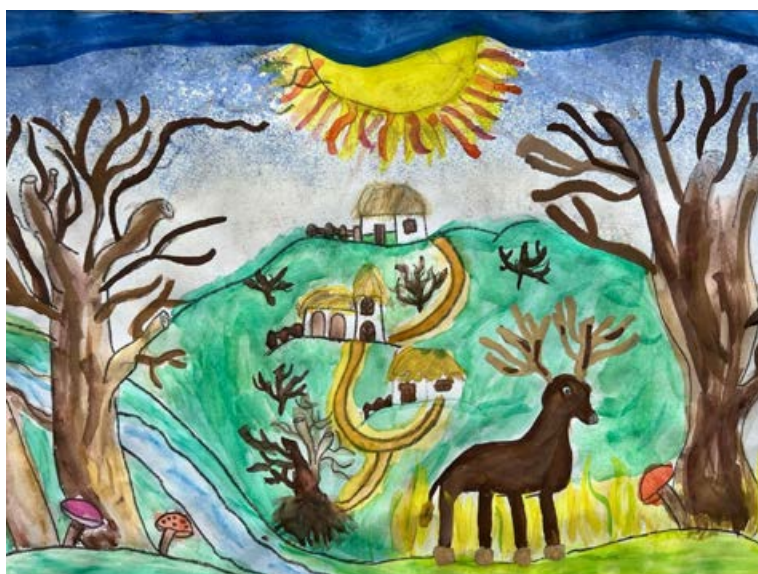
VÖRÖS BÁLINT 5.a Órségi tájon