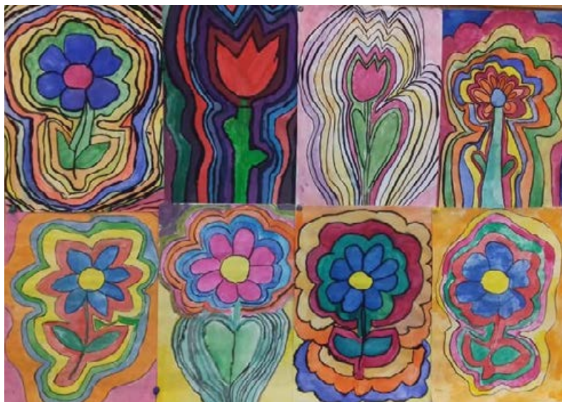
3.b osztály Virágok