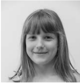
Stern Boróka 3.b