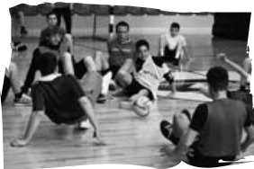
Olcsai-Somogyi közös sportnap

Látogatás a Búvösvölgyben – 4. és 6. évfolyam