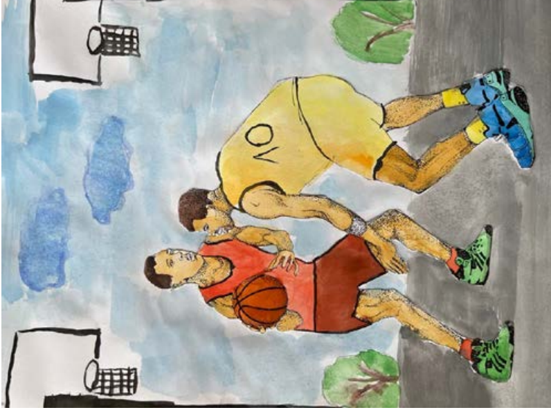
BAUXBERGER KATA 7.b Kosarasok