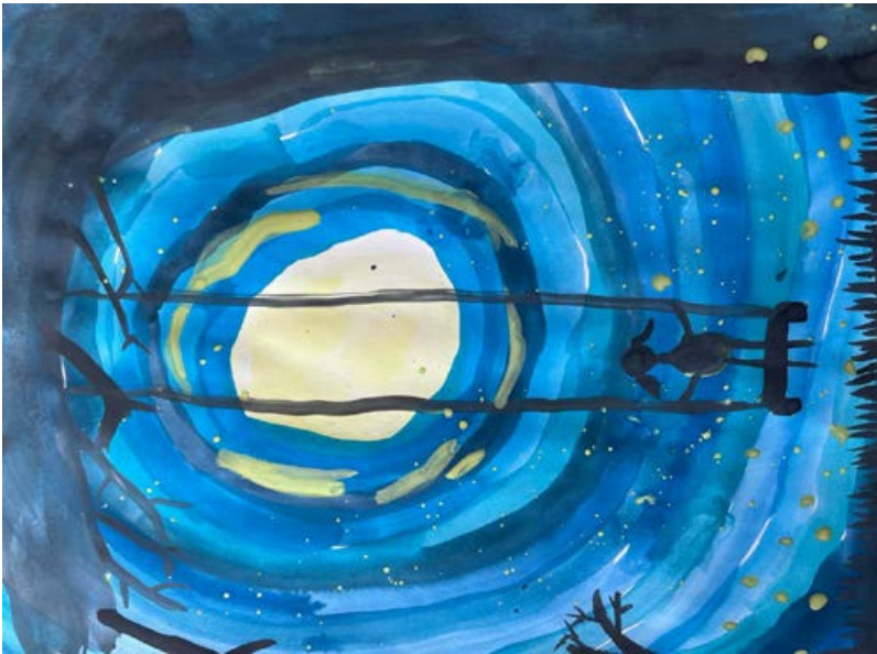
PALKÓ SZOFIA HANNA 2.b Hintázás