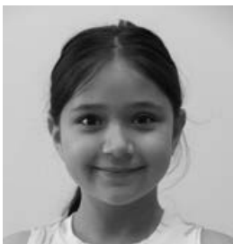
Murai Maja 1.b