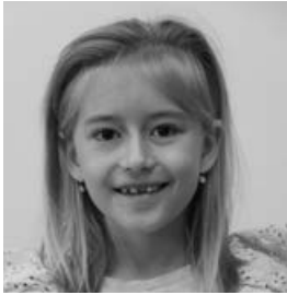
Vaspöri Panni 2.b