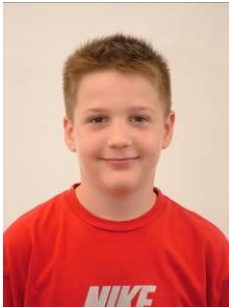
Major Soma 5.b kitűnő tanuló Országos francia tanulmányi verseny 3. helyezett