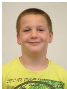
Major Soma 4.b