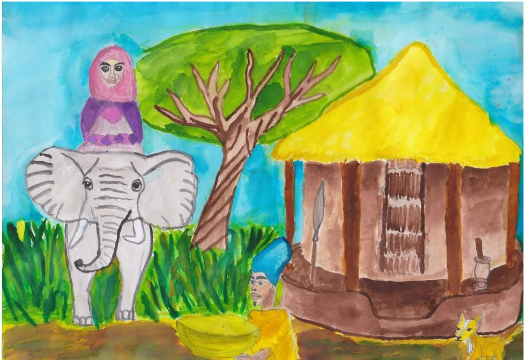
Bauer Orsolya 7.a: Afrika